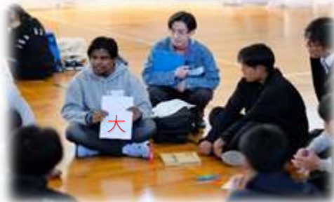
今の気持ちを漢字一文字で表すと・・・?