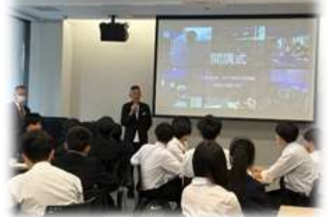
経営学部長による授業の様子