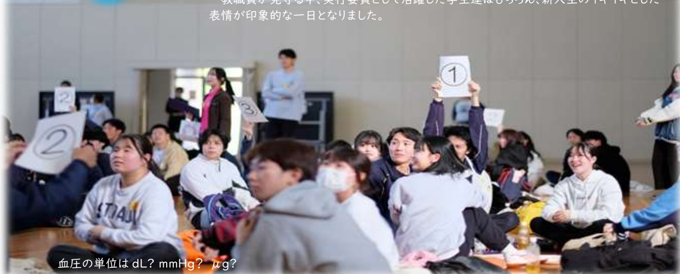
血圧の単位はdL? mmHg? \mu g?

教職員が見守る中、実行委員として活躍した学生達はもちろん、新入生のイキイキとした表情が印象的な一日となりました。