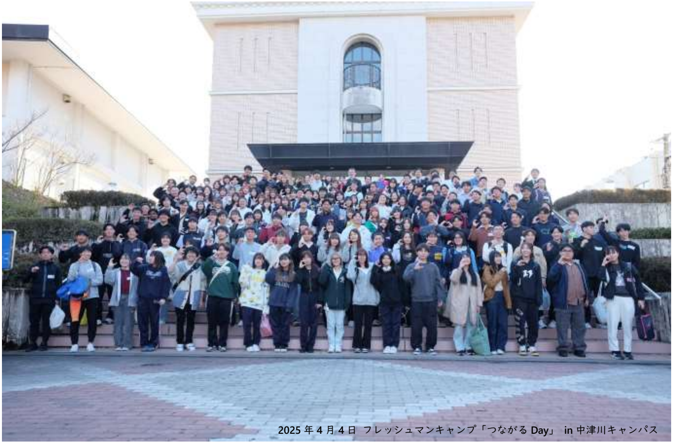
2025年4月4日 フレッシュマンキャンプ「つながる Day」 in 中津川キャンパス