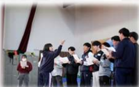
♪ダイナミックな指揮で奏でるハーモニー