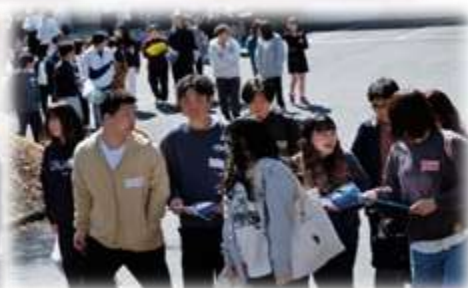
自然豊かなキャンパスで謎解きゲーム