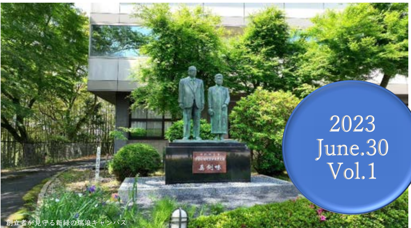
創立者が見守る新緑の瑞浪キャンパス