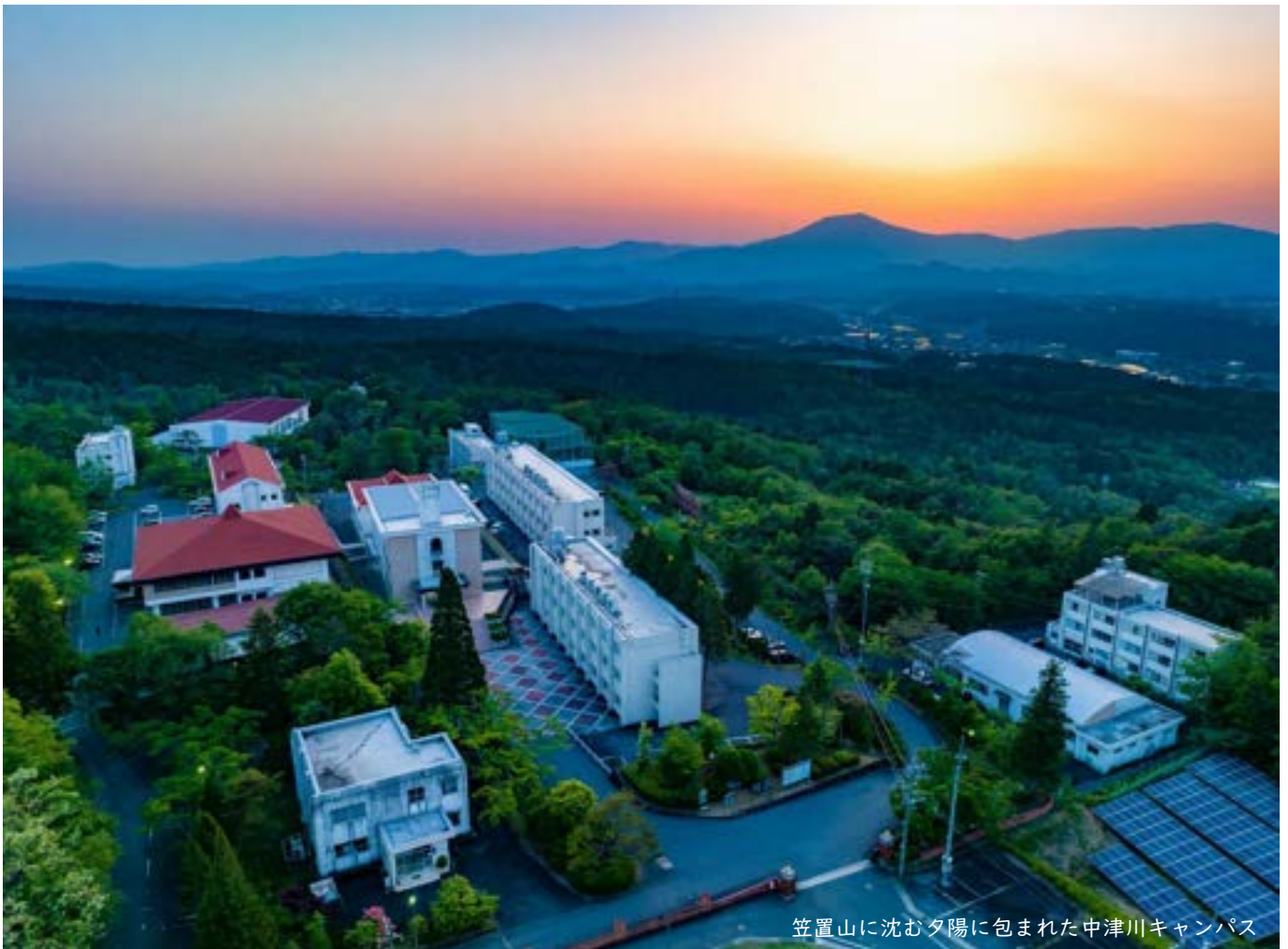
笠置山に沈む夕陽に包まれた中津川キャンパス