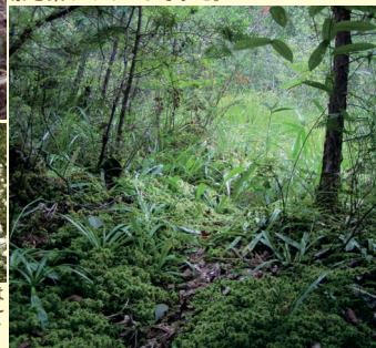
シラタマホシクサの開花は秋。白いホルタルが乱舞しているかのよう。