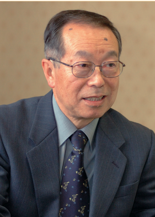
現場経験が豊富な篠原先生の話はとても説得力がある。