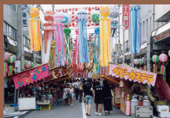
「美濃源氏七タまつり」が開催される日は、街中がお祭り気分一色に染まる。

演奏会や美濃源氏盆踊り大会をはじめ、街のあらゆる広場を舞台に繰り広げられるバサラ踊り、土岐川河畔で打ち上げられる市民祈願花火大会、さらに48時間でオブジェを完成させるクレイオオブジェ・コンテストも開催される。いずれの催しもぜひ一度は見ておきたいものばかりだ。