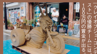
「クレイオオブジェ・コンテスト」の優勝チームには、100万円の賞金が出る。