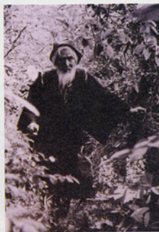
まるで森のような自宅の庭からひょっこりと顔を出す守一は、まるで森の精のようです。

96歳まで絵筆を持ち続けた「画壇の仙人」熊谷守一は、明治13年に付知町(現中津川市付知町)に生まれます。個性あふれる両風とともに気負わない言葉や自然体な生き方に共感するファンが多い画家です。