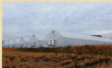
鈴木工業製のビニールハウス。中では水耕栽培の野菜が育てられています。