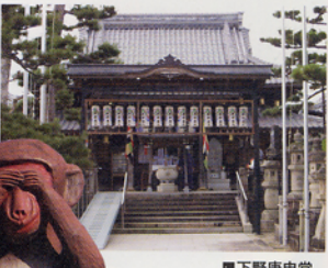
■下野庚申堂 岐阜県中津川市下野