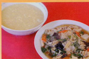
■五目あんかけ焼きそば (700円) は、自家製麺の上にとっぷりの野菜

中津川駅前通りにあるチャイニース勝宗は、お手頃価格で食べられる本格中華料理店です。平日のお昼はお得なランチセット(650円)が人気。餃子やチャーハンはお持ち帰りOKです。コース料理や座敷で小宴会もできます。