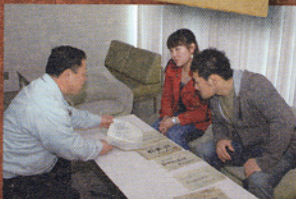
明治座に対する、当時の人たちの期待の大きさがわかる。