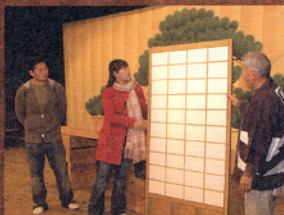
障子と襖がリバーシブルになっている。

今も使われているこの木戸は、明治座ができた当初からあるといわれています。戸の溝の通りやコマが木でできている事から明治座の道りであることがわかります。