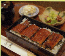
旬の食材を使った小鉢、みそ汁、揚げ物付き

お昼限定、900円のお手ごろメニューが入ります。末達の端物の「ーフライス」「お手ごろ天重」と、その日の食材を使った「お手ごろ天重」の2種類。鰻は井戸水で生かし、注文を受けてから焼く本格鰻。お急ぎの場合は来店時間を伝えておくこと、時間通りに食べられるよう用意をしてくれます。 4名程度の小部屋もあるので、子ども連れでもゆつくり食事ができます。