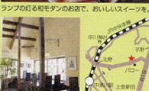
ランプの灯る和モダンのお店で、おいしいスイーツを。

岐阜県中津川市日田川1157-12 ☎0573-65-0805 営業時間/9:00~18:00 定休日/木曜日